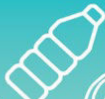
Μπουκάλια αναψυκτικών και ποτών