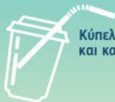
Κύπελλα και καπάκια