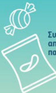
Συσκευασίες από πατατάκια/

Τα γλασκά αντικείμενα μιας χρήσης αντιπροσωπεύουν το 50% των απορριμμάτων στη θάλασσα