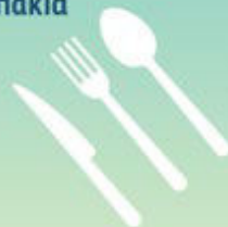
Μαχαιροπίρουνα, καλαμάκια και αναδευτήρες